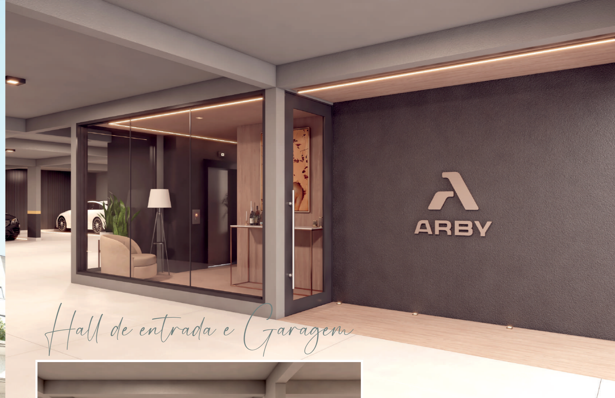
Hall de entrada e Garagem